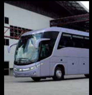
Diseño innovador y aerodinámico

¡Nosotros tenemos la solución adecuada para sus requerimientos!