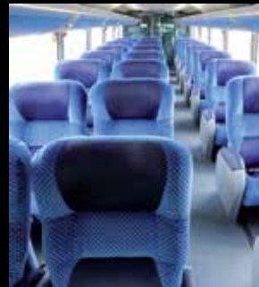
Nuevo ambiente más moderno, confortable y sofisticado