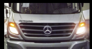
Mejor acceso frontal para mantenimiento; no es necesario desensamblar los faros principales para hacer cambio de filtro.