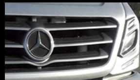
Mejor aerodinámica que ayuda a reducir el consumo de combustible.