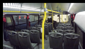
Mayor altura interior, permite más confort, y mejor disipación de temperatura.