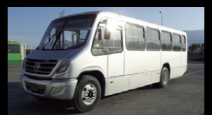
Mejor área de acceso.

¡Nosotros tenemos la solución adecuada para sus requerimientos!