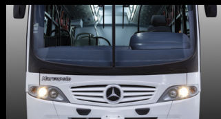
Su amplio frente brinda una correcta visión que aumenta la seguridad del vehículo y peatones.