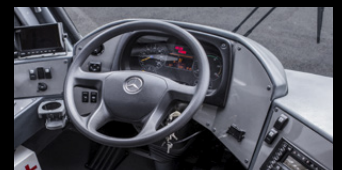
El tablero de controles asegura la mejor operación de la unidad, teniendo mayor comunicación entre el autobús y el operador.