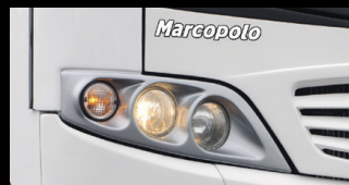
El diseño de su carrocería es gran ejemplo del estilo Mercedes-Benz.