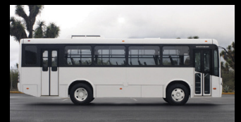
El Boxer OF, con sus tres modelos: OF 1118/41, OF 1318/44 y OF 1321/44, es ideal para cubrir las necesidades del mercado urbano.

Cada ciudad es un individuo. ¡Nosotros tenemos la solución adecuada para sus requerimientos!